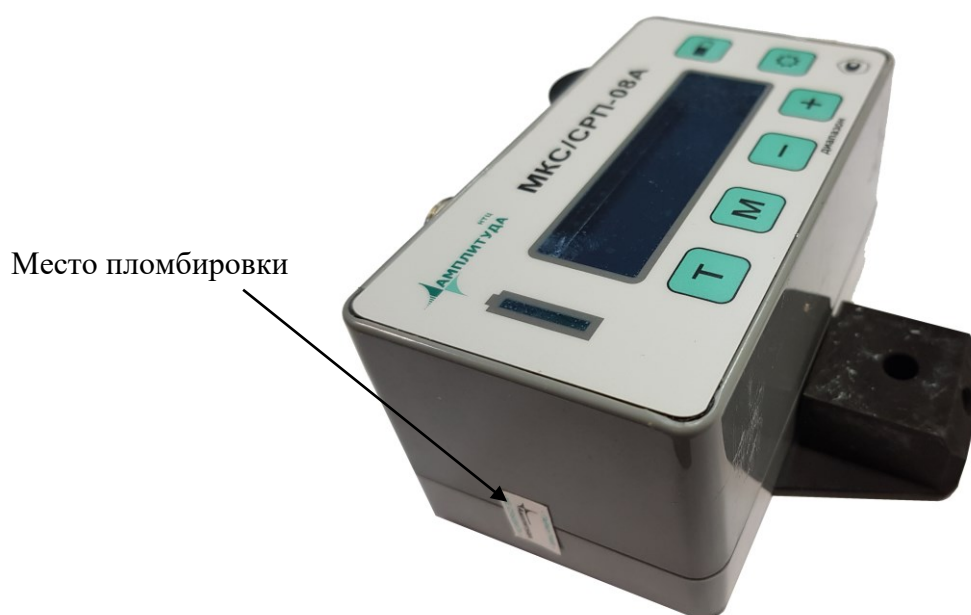
Рисунок 3 – Место установки пломбы на электронном блоке управления

Пломбирование блоков БДБС-25-01А и БДБН-01А осуществляется двумя пломбами, устанавливаемыми на винт крепления корпуса и на регулировочный винт. Пломбирование блока БДПС-02А осуществляется одной пломбой, устанавливаемой на винт крепления корпуса.